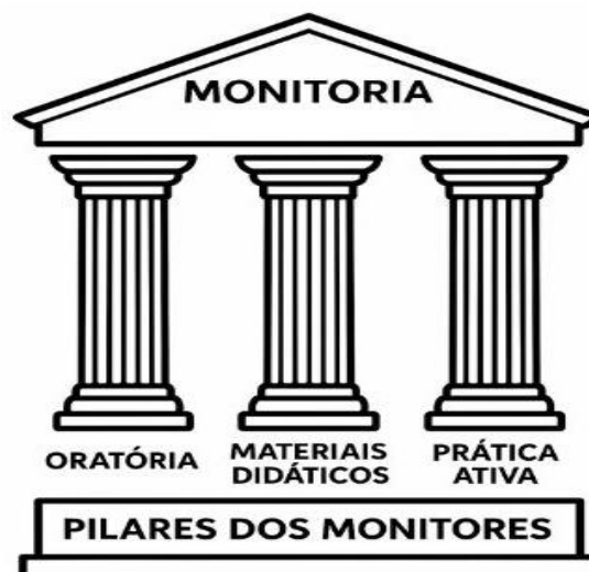
Figura 2. Pilares dos monitores.

Em relação à comunicação, prezou-se pela analogia entre ensino e a estrutura da arquitetura da Grécia Antiga (Figura 2), em coordenação e meditação dos monitores, para uma assertiva transmissão e diálogo com os discentes, ponto fundamental e de pareceres positivos destacados pelos monitorados, pela didática e oratória.